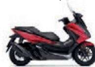
Nová barva 2023 Pearl Siena Red