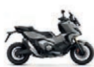
Pearl Deep Mud Grey