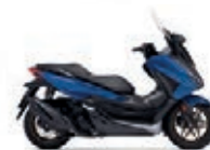
Mat Pearl Pacific Blue