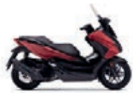
Mat Carnelian Red Metallic