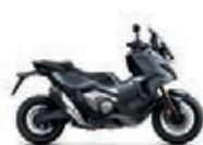
Mat Iridium Grey Metallic