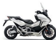
Mat Beta Silver Metallic