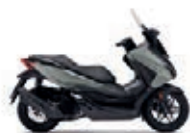
Pearl Falcon Gray