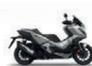
Pearl Deep Mud Grey