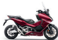
Candy Chromosphere Red