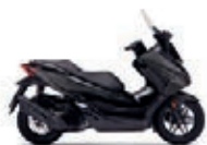
Mat Cynos Gray Metallic