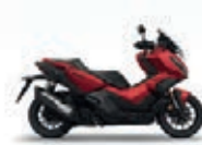
Mat Carnelian Red Metallic