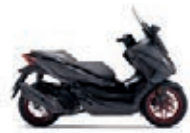
Nová speciální edice 2023 Mat Cynos Gray Metallic