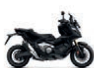
Mat Balistic Black Metallic