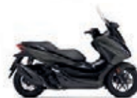
Mat Cynos Gray Metallic