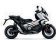
Nová barva 2023 Xadv Shashta White