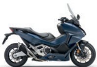
Mat Jeans Blue Metallic