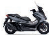
Nová barva 2023 Mat Robust Gray Metallic