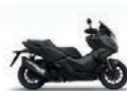
Mat Cynos Gray Metallic