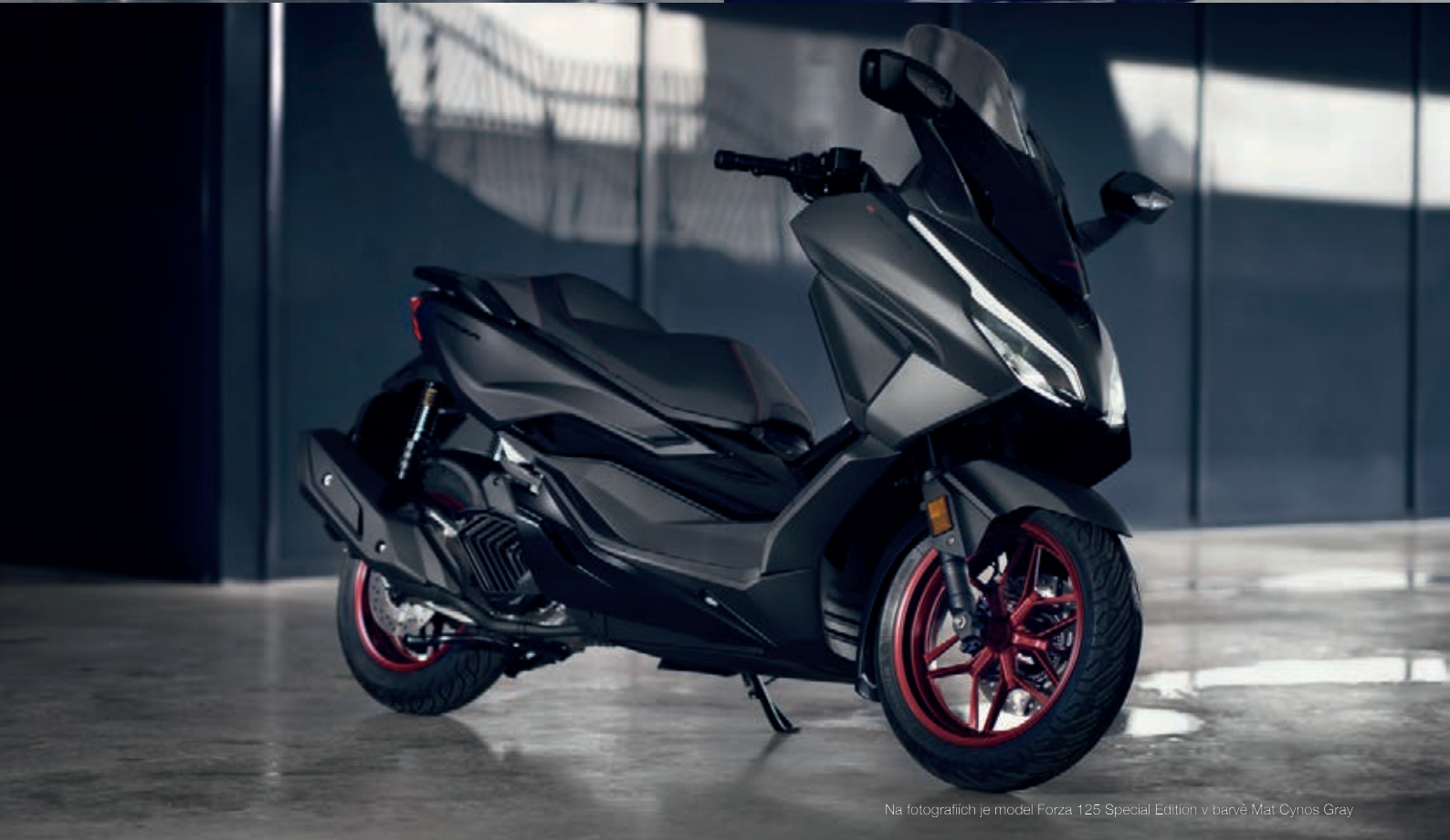
Na fotografiích je model Forza 125 Special Edition v barvě Mat Cynos Gray