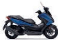
Pearl Mat Pearl Pacific Blue