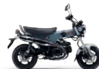
Pearl Cadet Gray