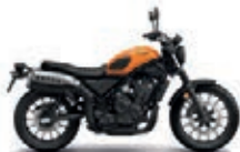
Candy Energy Orange