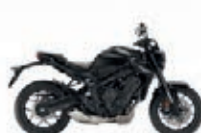
Nová barva 2023 Mat Gunpowder Black Metallic