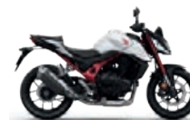
Pearl Glare White