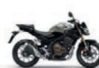
Pearl Smoky Grey