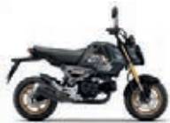
Nová barva 2023 Mat Dim Grey Metallic