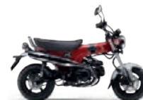
Pearl Nebula Red