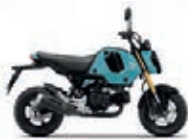
Nová barva 2023 Splendid Blue