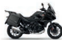
Nová barva 2023 Graphite Black