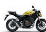
Pearl Dusk Glow Yellow