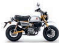
Nová barva 2023 Banana Yellow