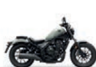
Nová barva 2023 Pearl Smoky Gray