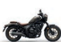
Nová barva 2023 Titanium Metallic (FOP)