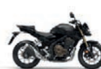
Mat Axis Gray