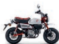
Nová barva 2023 Pearl Nebula Red