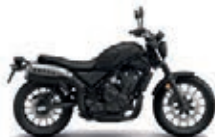
Mat Gunpowder Black Metallic