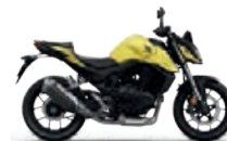
Mat Goldfinch Yellow