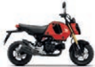
Pearl Gayety Red