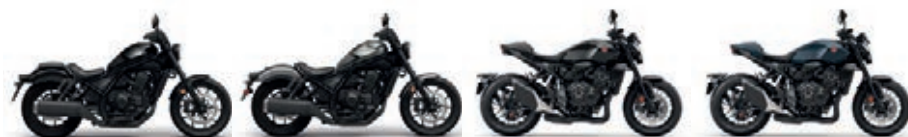
Gunmetal Black Metallic