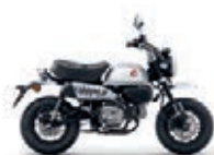
Nová barva 2023 Pearl Shining Black