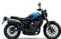
Candy Caribbean Blue