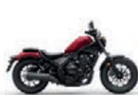
Nová barva 2023 Candy Diesel Red