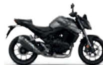
Mat Iridium Gray Metallic