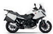
Pearl Glare White