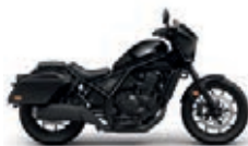
Novinka 2023 CMX1100T Gunmetal Black Metallic