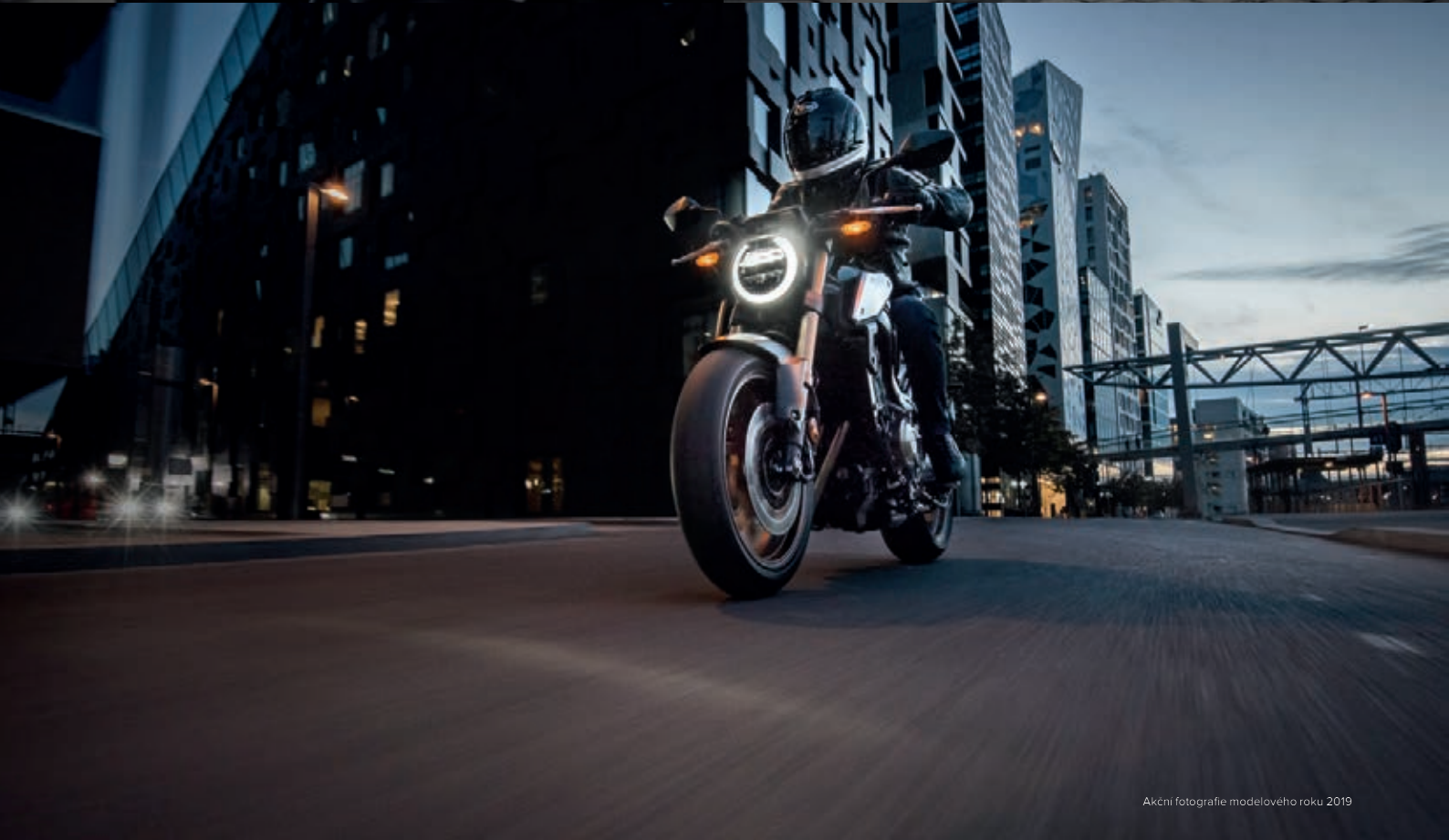
Akcni fotografie modeloveho roku 2019