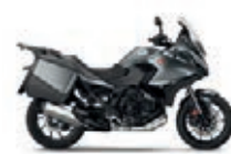
Mat Iridium Grey Metallic