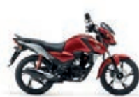
Pearl Splendor Red