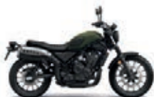
Mat Laurel Green Metallic