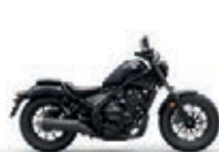
Nová barva 2023 Mat Gunpowder Black Metallic