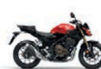
Grand Prix Red