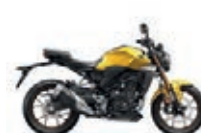
Pearl Dusk Yellow