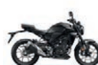
Mat Gunpowder Black Metallic