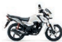
Pearl Cool White