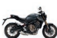
Nová barva 2023 Mat Dim Grey Metallic