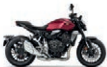
Nová barva 2023 Bordeaux Red Metallic