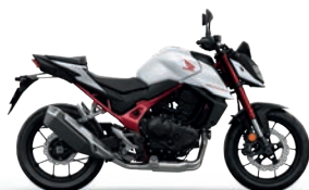
Pearl Glare White