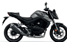
Mat Iridium Gray Metallic